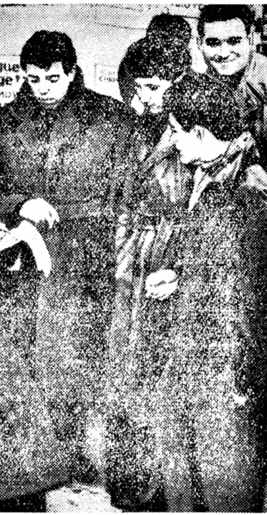
Молодежь французского города Сюрен создала Комитет борьбы за мир в Северной Африке. Представители комитета явились на съезд социалистической партии Франции, состоявшийся некоторое время назад, и заявили: «Мы требуем мира в Алжире и Марокко». На снимке: члены комитета беседуют с корреспондентом молодежной газеты «Авангард».

Эрвин ЦУКЕР-ШИЛЛИНГ, австрийский журналист ВЕНА, 28 февраля. (По телефону)